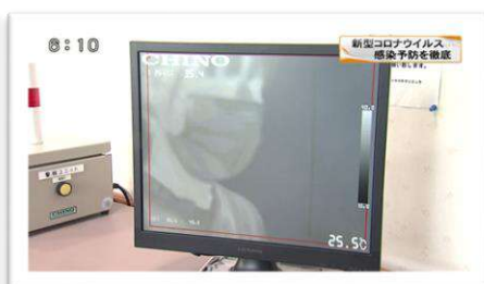
赤外線カメラによる検温